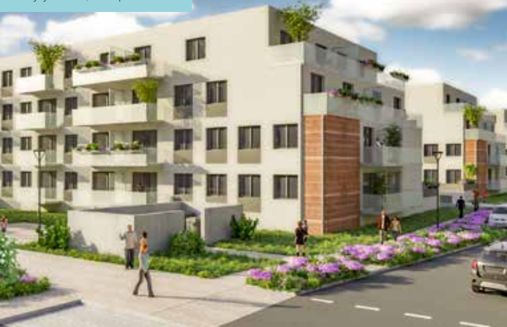
Byty Šibeník, 2. etapa - Olomouc