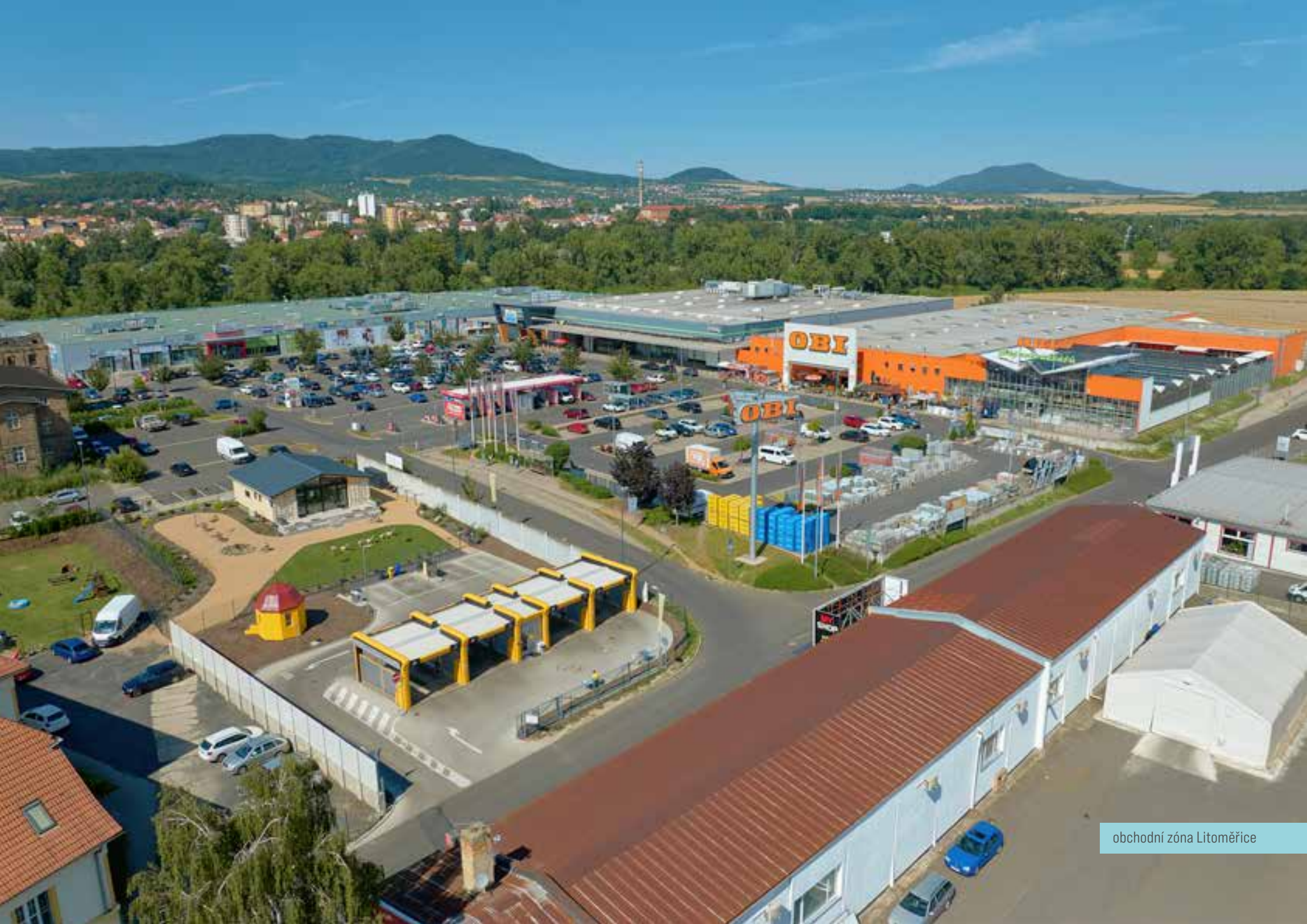
obchodní zóna Litoměřice