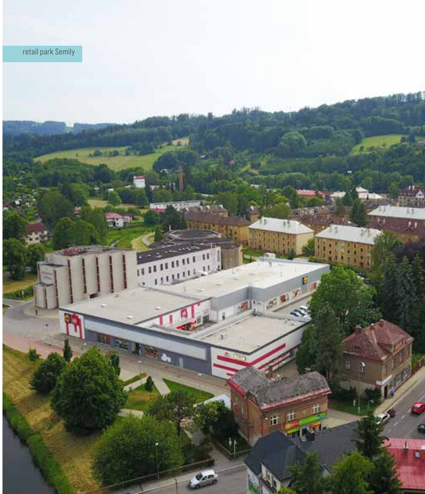
retail park Semily