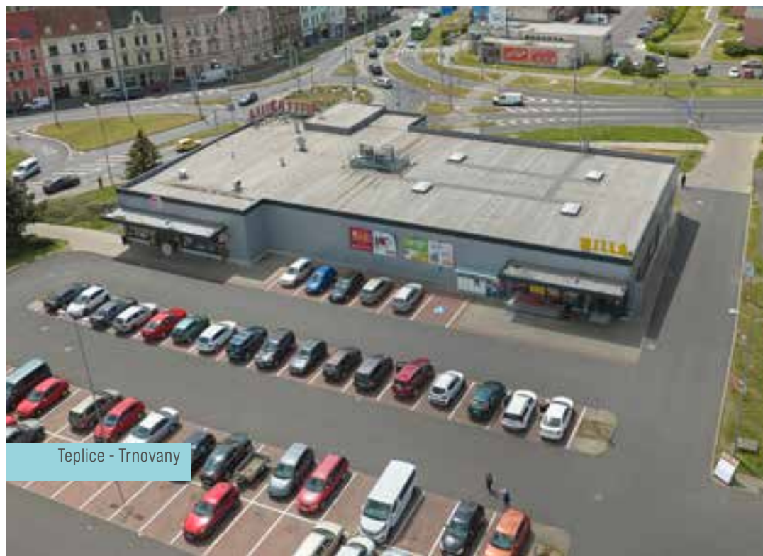
Teplice - Trnovany