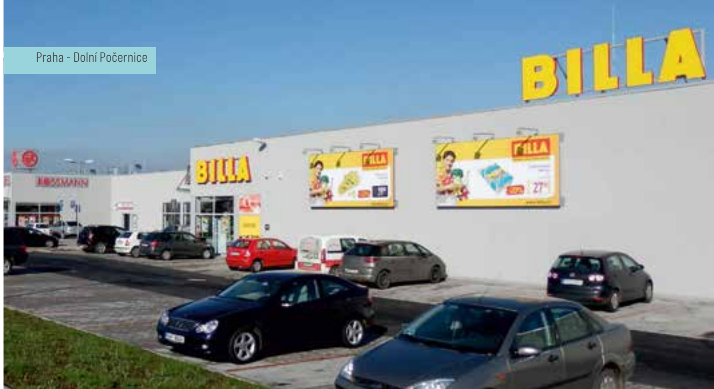
Praha - Dolní Počernice