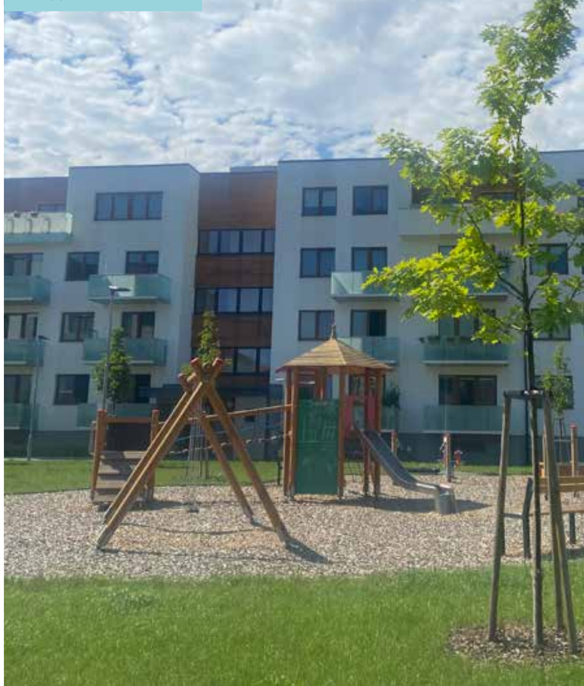
Byty Šibeník, 1. etapa - Olomouc