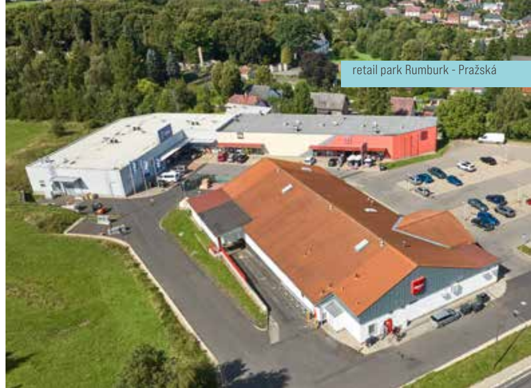
retail park Rumburk - Pražská