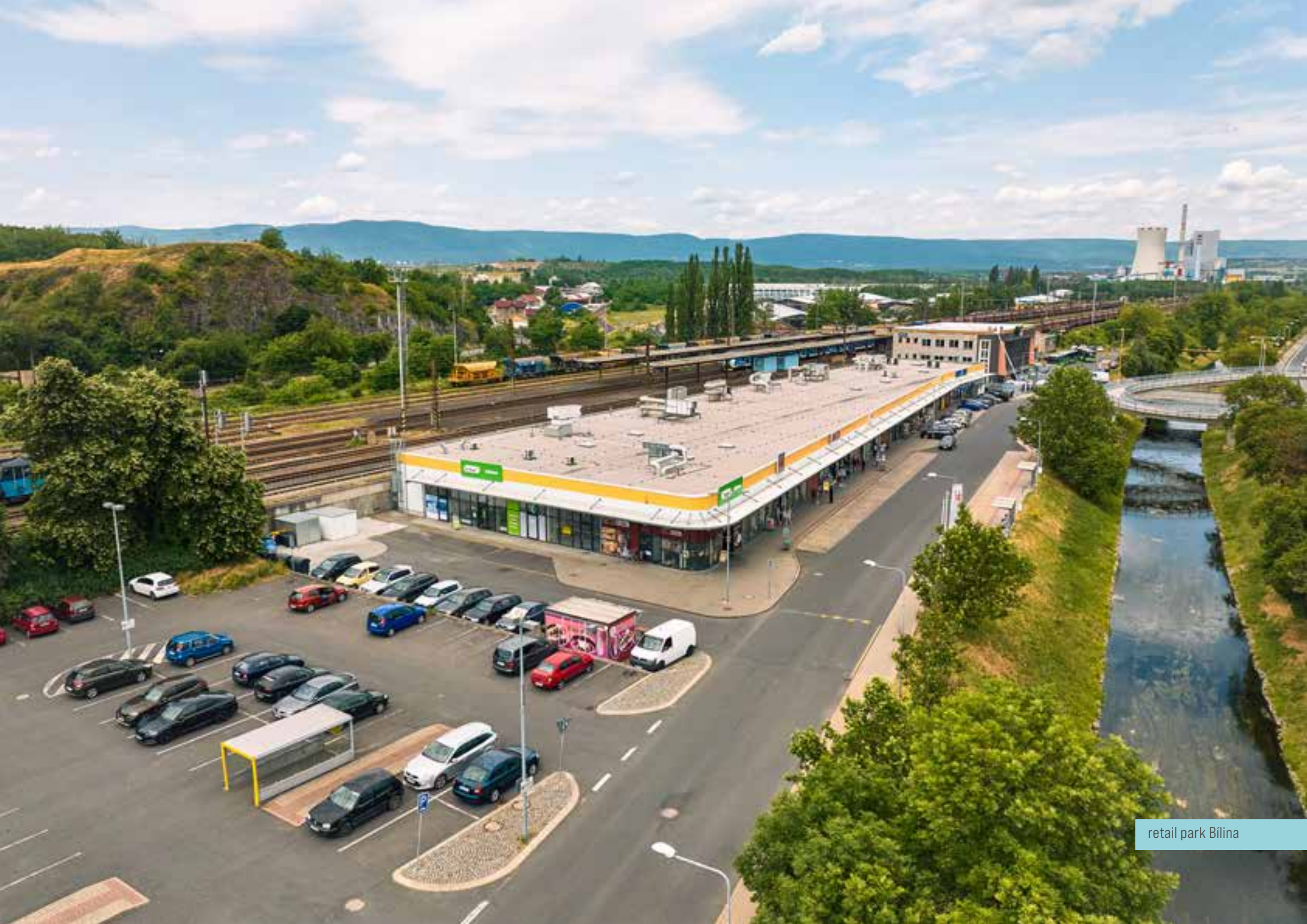
retail park Bílina