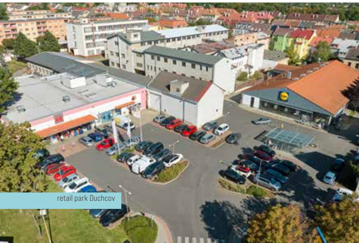
retail park Duchcov