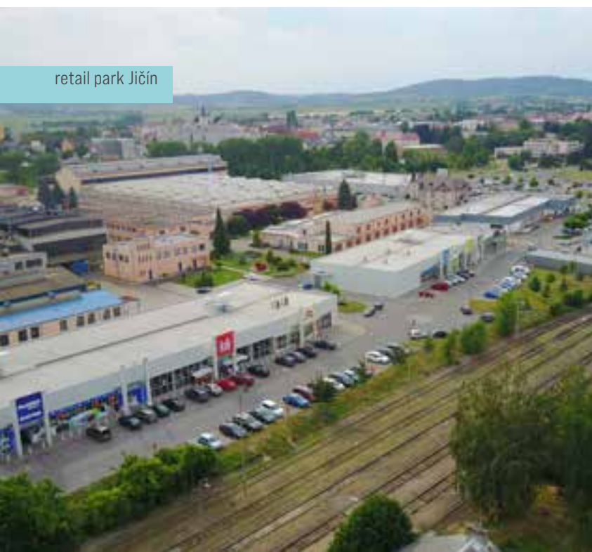
retail park Jičín